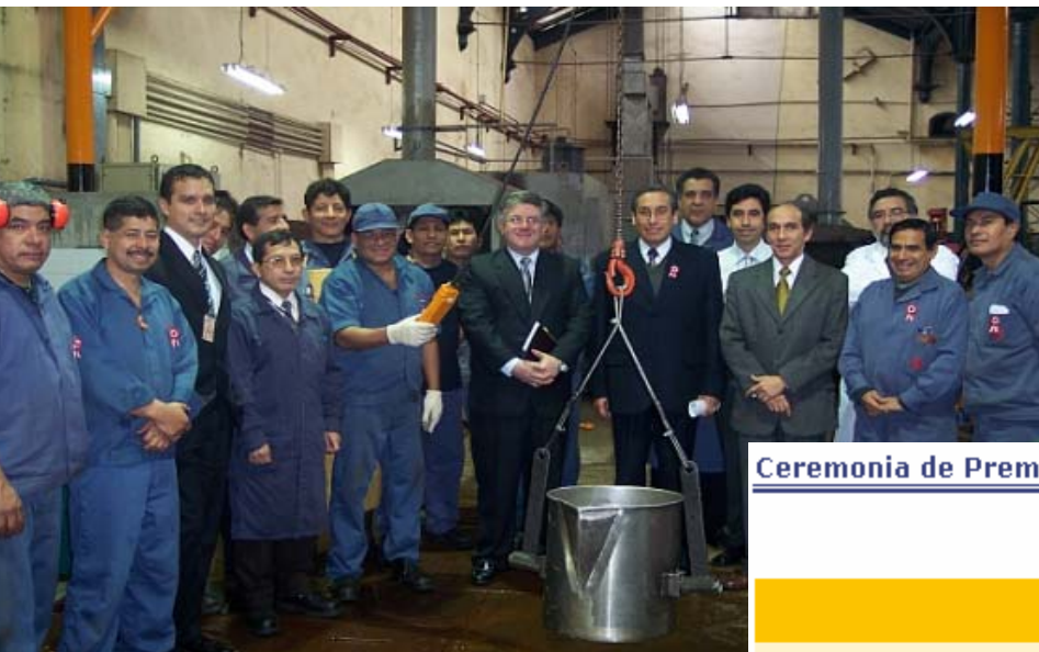
Ceremonia de Premiación del Concurso Escolar del BCRP